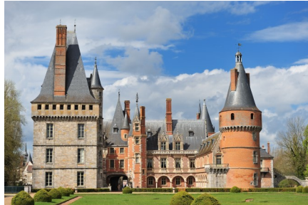
Château de Maintenon