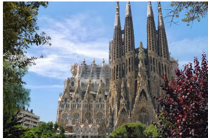
Barcelone : La Sagrada familia